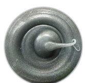
Graualuminium RAL 9007 Art.-5-1-3-2-169