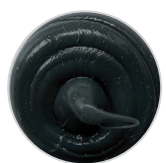
Anthrazitgrau RAL 7016 Art.-5-1-3-2-43